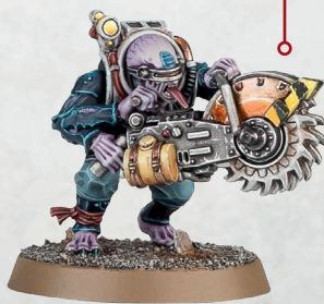
アコライト・ハイブリッド