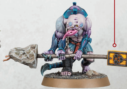
アベラント・ハイパーモーフ