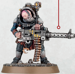
ネオファイト・ハイブリッド