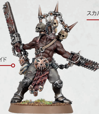
ジャカル・バックリダー